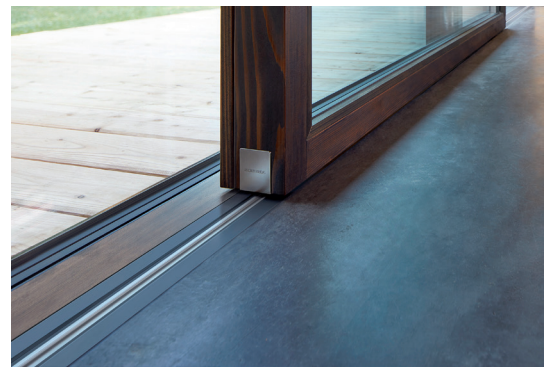
Rahmenlos & Barrierefrei