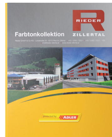
RIEDER Zillertal Farbkarte